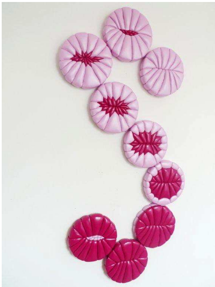
« Sisyphé II » - Installation de 9 éléments textile, 2011