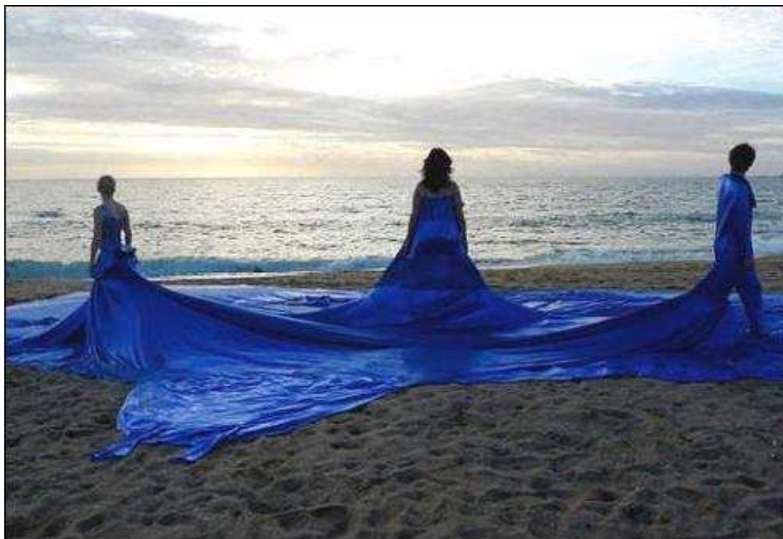
Vidéogramme tiré de la vidéo « Beach Noise », 2010