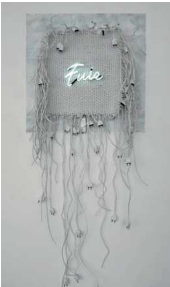
« Fuir » - Tressage de câbles électriques, prises, néon, 2010 Photo: ©Fred Hurst – Courtesy Naji Kamouche – Courtesy School Gallery, Paris