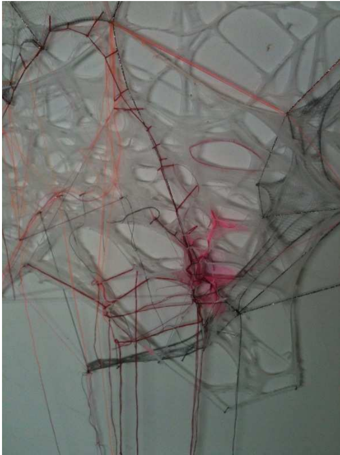
« La Pangée », installation in situ, détail, 2011