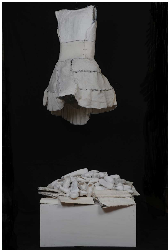
« Port Royal » - 2009

« Port Royal » - Installation robe, chaussons, magazines, technique mixte : bandes plâtrées, gaze chirurgicale, épingles... - 2009 - Série « 100/Fil » - 130 x 96 cm chacun - Papier calque millimétré sur tarlatane blanche, fil de lin et fil à coudre, épingles à nourrice, épingles, papier plâtré - 2011