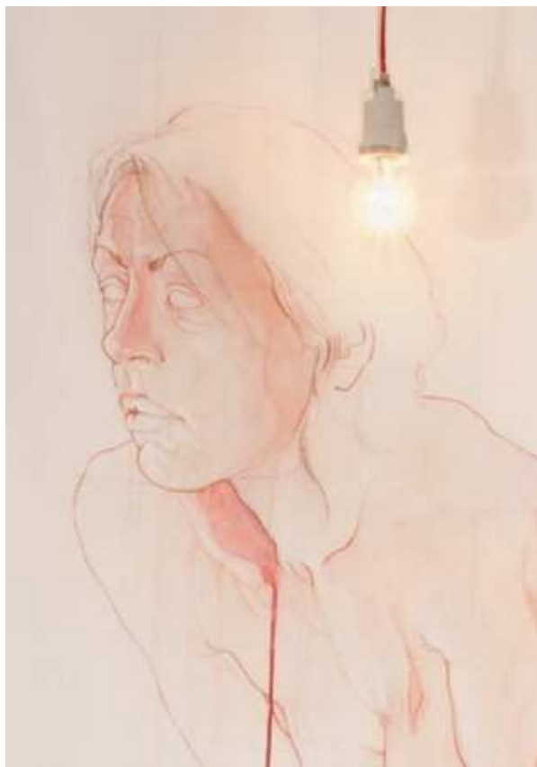
“Spasmes et douleurs”, détail, 2011

“Spasmes et douleurs” - 1mx2m, sanguine, crayons de couleur, acrylique et encre sur toile, préparation, gesso, fil électrique, douille en porcelaine mate, ampoule, 2011